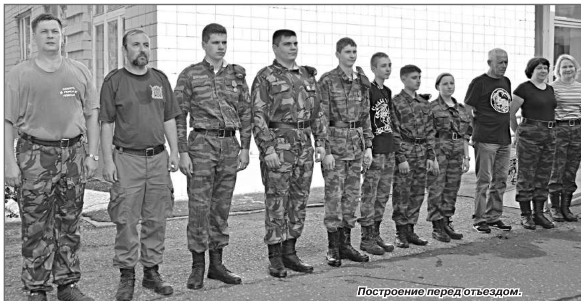
Построение перед отъездом.